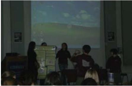
Das Siegerplakat der Posterpräsentation

Unter dem Motto „Making the most of medicine“ wurden Vorträge zu kardialen, pulmonalen und abdominalen Notfallsituationen präsentiert und die Theorie im Anschluss im Workshopteil aktiv praktisch umgesetzt. Ergänzt wurde das Programm durch Posterpräsentationen junger Forscher.