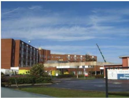
Das Mullingar Regional Hospital

Ein weiterer Punkt der in irischen Kliniken sehr ernst genommen wird, ist die Fortbildung ihres Personals. Mehrmals wöchentlich treffen sich Ärzte und Schwestern, um die neuesten Publikationen zu diskutieren. Jede Woche stellt jemand ein Thema vor, dass dann gemeinsam erarbeitet wird. Zeitdruck scheint es dabei (und auch sonst) nicht zu geben, wenn es etwas zu besprechen gibt, dann wird das eben gemacht.