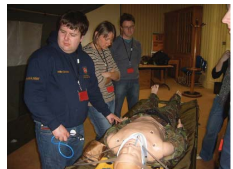
Interaktive Simulation am Dummy durch Royal Army

Die irische Version ist aber durchaus keine Neuauflage der amerikanischen TV-Serie, sondern ein studentischer Kongress rund um die Notfallmedizin, der im März 2008 zum dritten Mal an der Queen's University im nordirischen Belfast ausgetragen wurde.